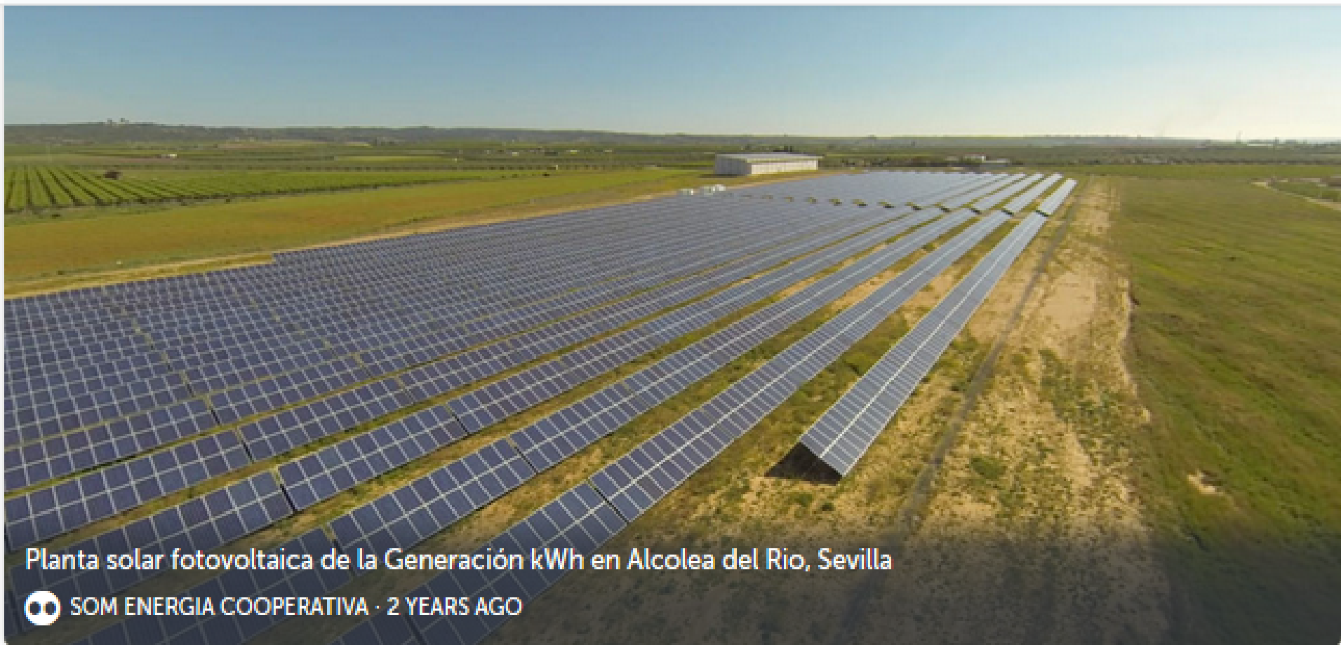
Planta solar fotovoltaica de la Generación kWh en Alcolea del Río, Sevilla